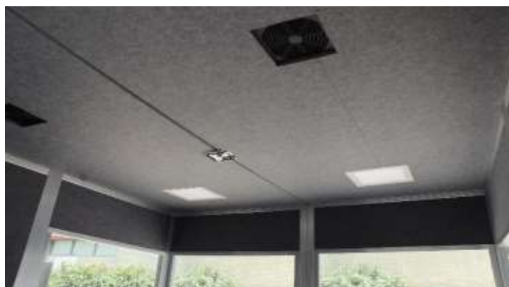
particolare delle luci LED e ventola di aerazione