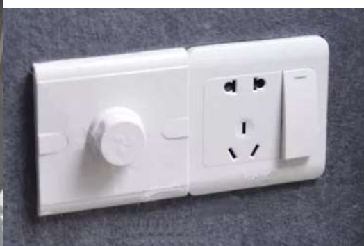
particolare regolatore luce LED e ventole